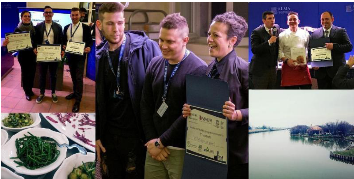
I primi tre classificati a livello nazionale della scorsa edizione del concorso "Upviviium: Biosfera gastronomica a km 0"

Le Riserve di Biosfera provvederanno a pubblicare la graduatoria del concorso ed i vincitori sul sito internet dell'iniziativa e sui loro strumenti di comunicazione.